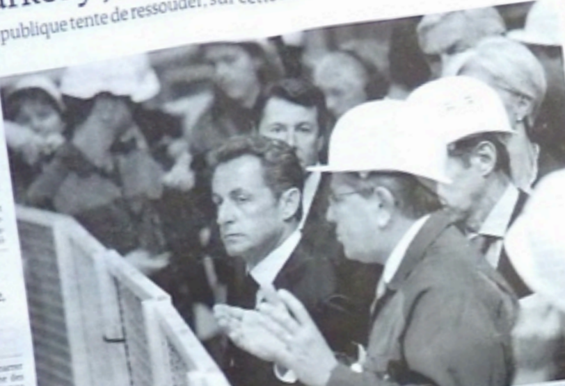
Nicolas Sarkozy, le 2 septembre, lors d'une visite de l'usine Valinox Nucléaire à Montbard, en Côte-d'Or.

Le président de la République tente de ressouder, sur cette réforme majeure, une majorité en proie au doute