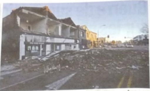
NOUVELLE-ZÉLANDE APRÈS LE SÉISME, LA TEMPÊTE

Finis les odes à l'équipe de foot black blanc bleu. La rentrée, en Allemagne, est animée par le livre pamphlétaire de Theo Sarasin, haut fonctionnaire de la Banque centrale, qui reproche aux immigrants turcs et arabes de n'être que des «marchands de fruits et légumes». L'ouvrage dénonce le déclin de l'Allemagne au profit des immigrés musulmans. Sarasin, déjà en passe d'être chassé du directoire de la Bundesbank pour des propos antisémites, a été vilipendé par la classe politique. Mais il glisse à l'opinion, selon une étude, un Allemand sur deux trouve qu'il y a trop d'étrangers. L'Allemagne compte 15,6 millions d'étrangers ou de nationaux d'origine étrangère, dont 4 millions de musulmans, sur 82 millions d'habitants.