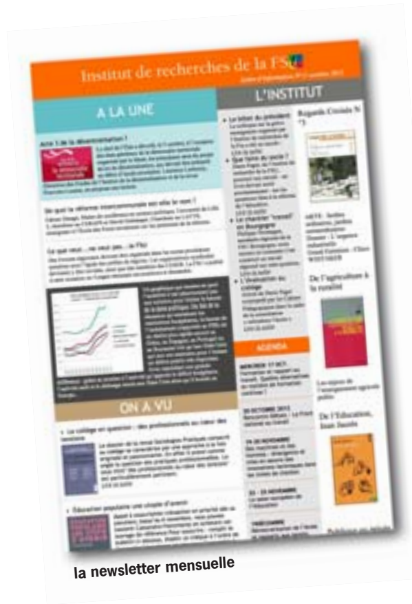
la newsletter mensuelle