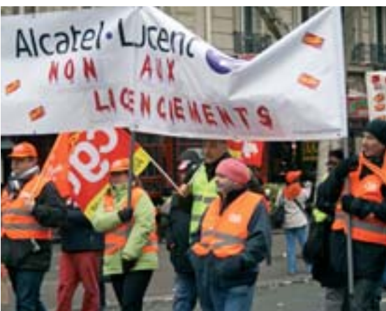
Les licenciements dans les grandes entreprises, premier facteur d'aggravation du chômage.

Sans attendre le résultat de ces négociations, devant les sombres prévisions de croissance et la perspective de ne pas respecter l'objectif de