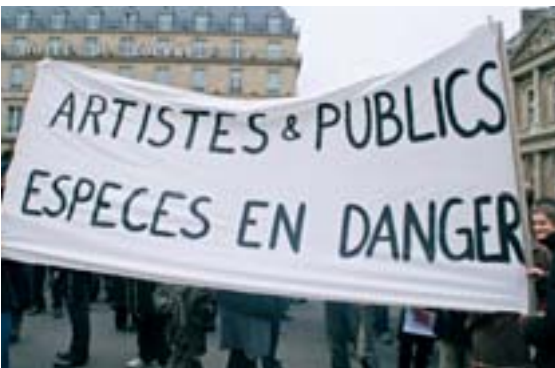
Les arts vivants en mal de financements.

Conséquences : les grandes institutions ont été mises au régime sec avec une baisse de plus de 7 % pour l'Opéra de Paris, le Grand Palais et le Centre des monuments nationaux. 150 millions ont été supprimés au