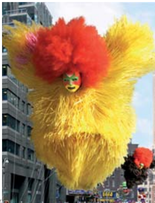
Les festivités de Fantastic ont débuté par une grande parade dans les rues de Lille. À sa tête, un géant échevelé de 8 mètres, créature de l'artiste Nick Cave.

Lille explose chaque année en événements culturels hors normes. L'édition 2012, baptisée Fantastic, propose trois mois de festivités échevelées.