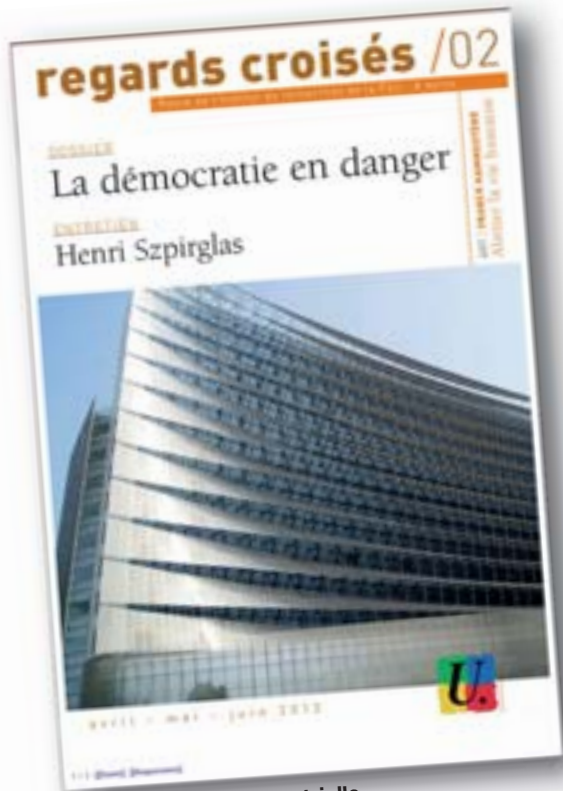
la nouvelle revue trimestrielle

« Regards croisés » + « La lettre électronique »