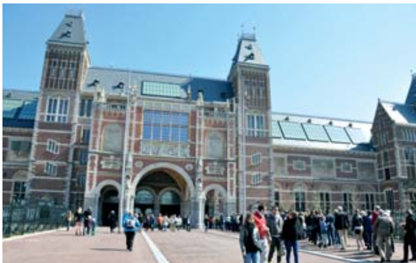
Le 19 avril, le Rijksmuseum a rouvert ses portes, après dix longues années de travaux de réhabilitation, de rénovation et de restauration.

La présentation des célèbres collections du musée a elle aussi été entièrement repensée, offrant aujourd'hui un parcours chronologique retraçant l'histoire hollandaise du Moyen-Âge au XX e siècle. Y sont présentés pêle-mêle des peintures, sculptures, objets d'art