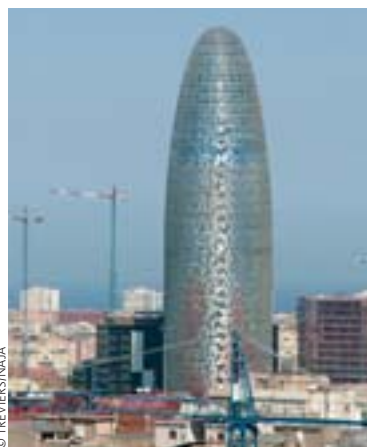
L'Espagne en 2007, avant la bulle immobilière

Chômage (25 % de la population active), surendettement et incapacité de rembourser : 200 000 familles espagnoles ont été expulsées de leur logement l'an passé à la demande des banques. L'arrivée massive de ces logements sur le marché depuis 2008 a provoqué l'effondrement de la bulle immobilière, leur vente ne suffisant plus à éponger les dettes des familles. Une série de suicides a provoqué la prise de conscience de la gravité de la situation. Fondée en 2009 à Barcelone, la PAH lutte contre les expulsions, effectue la médiation entre les familles, les banques et la justice, et négocie pour éviter les drames. Elle s'appuie notamment sur de grands rassemblements et des manifestations. Ayant réuni plus de 1,4 million de signatures, elle a obligé le parlement espagnol à examiner en février une Initiative législative