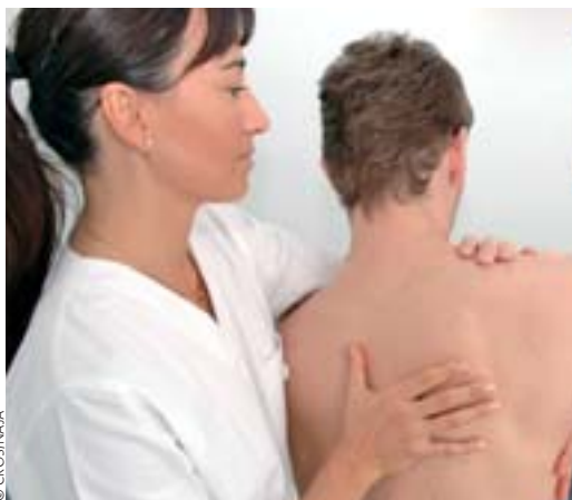
Un projet de protocole sur l'amélioration des conditions de travail prévoit le renforcement de la médecine de prévention.