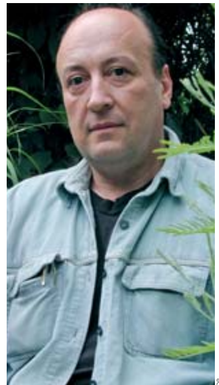
Pierre-Henri Gouyon, professeur au Muséum national d'Histoire naturelle.

versité des semences est un risque pour l'avenir, parce qu'elle rend la production agricole mondiale très fragile vis-à-vis des aléas biologiques (virus et autres prédateurs). Elle montre aussi les banques de semences permettent de conserver les gènes des plantes, mais que les graines meurent si elles ne sont pas mises en culture tous les 10 ans. Les citoyens doivent avoir ces faits en tête lors des débats sur les méthodes des multinationales de l'agroalimen-