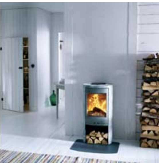
Le chauffage des habitations et des bureaux représente près de la moitié de la consommation d'énergie.

L'énergie est partie intégrante de notre société : elle nous permet de nous chauffer – ou de nous rafraîchir,