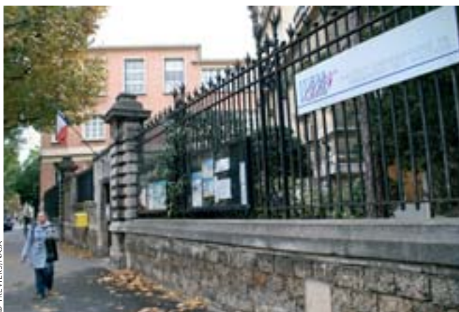
La confusion règne aussi quant au sort des équipes d'IUFM et du réemploi, dans l'ESPE, de certains formateurs actuels.

Bricolage, opacité... Force est de constater que la préparation de l'ouverture des Écoles supérieures du professorat et de l'éducation pour la rentrée prochaine se fait dans la précipitation et sans transparence au plan local (le plus souvent) comme au plan national.