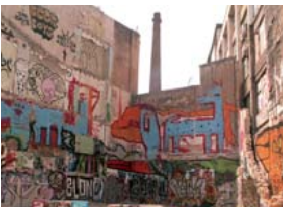
Les anciennes usines et les immeubles abandonnés, espaces préférés des taggeurs.

Aujourd'hui, on prend essentiellement connaissance de la création artistique par Internet et les ventes internationales des œuvres les plus cotées. Porteuses de tant de découvertes stylistiques et de dénonciations, la