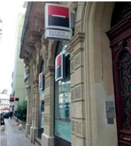
La Société Générale, champion des produits dérivés, annonce la suppression de mille postes.

Point positif, le texte prévoit l'inter-