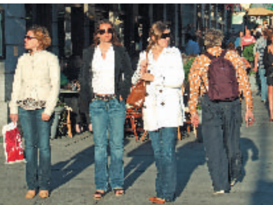
Concilier vie professionnelle et familiale est une gageure.

Les jeunes femmes, grâce à leur niveau de formation plus élevé accèdent plus nombreuses que les hommes à des emplois qualifiés (48 % contre 43 %) ; elles n'étaient que 30 % en 1984 pour 33 % des garçons. Elles restent cependant globalement moins payées (temps partiel plus fréquent) et, du fait de leurs choix de formations, n'en tirent pas pleinement profit. Plus nombreuses à exercer des fonctions de responsabilité, sans pour autant avoir obtenu l'égalité salariale, elles n'ont pas encore pu briser le plafond de verre qui les maintient écartées de la haute fonction publique ou des conseils d'administration des grandes entreprises. La « maternité » (et ses suites) est-elle l'obstacle majeur souvent avancé par les employeurs, ou la défiance envers les femmes recouvre-t-elle des facteurs bien plus complexes comme, on y revient, l'empreinte gelée des stéréotypes ? Certes, tant que le partage des tâches n'est pas