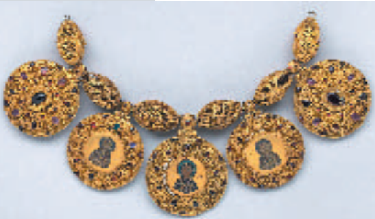
Barmes (collier avec émaux de Staraja Riazan, xiie siècle).

L'année 2010 est l'année de la Russie en France. Elle est marquée autant par des contacts politiques soutenus et des perspectives d'accords économiques que par la diversité d'une programmation culturelle dans les deux pays.