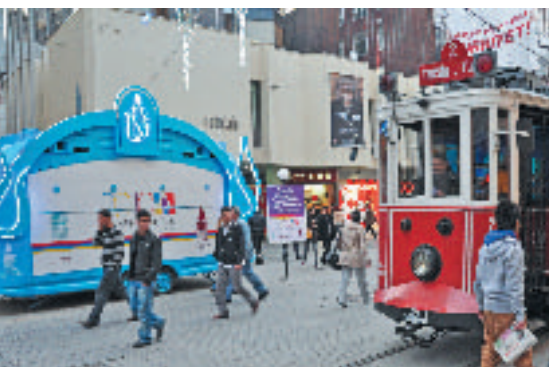
L'enseignement du Français contribue à nouer des relations avec des pays éloignés.

La presse n'est pas tendre non plus. Dans le grand quotidien Hürriyet, on peut lire cette charge redoutable : « 65% des habitants vivent dans les quartiers de la périphérie, où la misère et l'exploitation règnent sans partage. (...) Istanbul est une ville désorganisée, dépourvue de toute planification. Tout