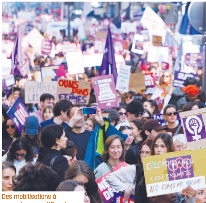
Des mobilisations à poursuivre, amplifier et élargir.

Refusant la banalisation de la guerre comme continuation de la politique impérialiste par d'autres moyens, la FSU met également en avant sa solidarité avec les peuples et participe aux initiatives en faveur du droit international et de la paix. Notamment un meeting de solidarité avec les syndicalistes