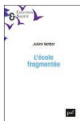
Julien Netter, L'école fragmentée (PUF, 256 pages, 26 euros)

En effet, la coordination entre les différent-es acteurs et actrices de l'école est assez limitée de par les conditions d'exercice des un-es et des autres qui interviennent sur des temps complémentaires ne laissant pas de possibilité matérielle d'échanges. Sans compter des his-