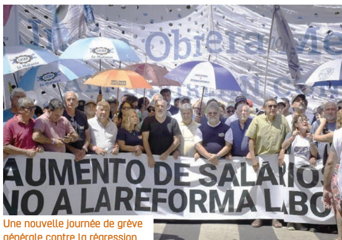
Une nouvelle journée de grève générale contre la régression des droits des salarié-es.

Après avoir en juin 2024 fait adopter au Parlement une loi de dérégulation de l'économie (la ley bases), Milei avait néanmoins subi plusieurs revers : le congrès avait surmonté son veto sur le renforcement de la protection sociale des personnes avec un handicap, et le pouvoir a été touché par des affaires de corruption. Cela n'a pas empêché son succès inattendu aux législatives partielles d'octobre 2025. Ainsi renforcé, Milei est dans la foulée parvenu à faire voter en février, en dépit d'une nouvelle journée de grève générale, de nouvelles réformes qui se traduisent par une impressionnante régression de la législation sociale et des droits des salarié-es. Dans la logique ultra libérale du président « anarcho capitaliste », la loi facilite les licenciements, réduit les pla-