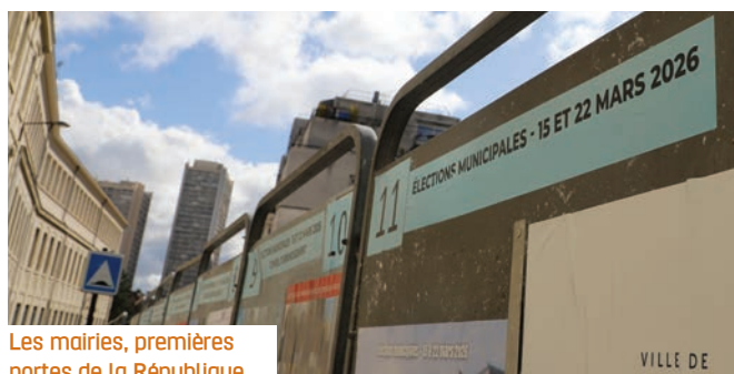
Les mairies, premières portes de la République.

Elle souligne que cette force politique ne se limite pas à un programme électoral : elle fragilise la démocratie, réduit les droits sociaux et impose une vision autoritaire de la société. La tribune rappelle que les élections municipales sont un moment décisif. Les mairies, premières portes de la République, organisent le quotidien : écoles, crèches, logements, transports, services publics, lieux culturels et démocratie