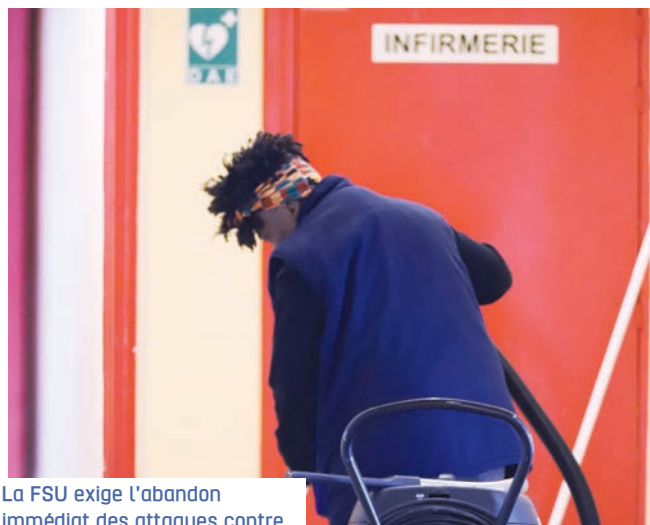
La FSU exige l'abandon immédiat des attaques contre les droits des agent-es.

De plus, le projet de décret établit une liste limitative de motifs et de conditions d'ASA (en