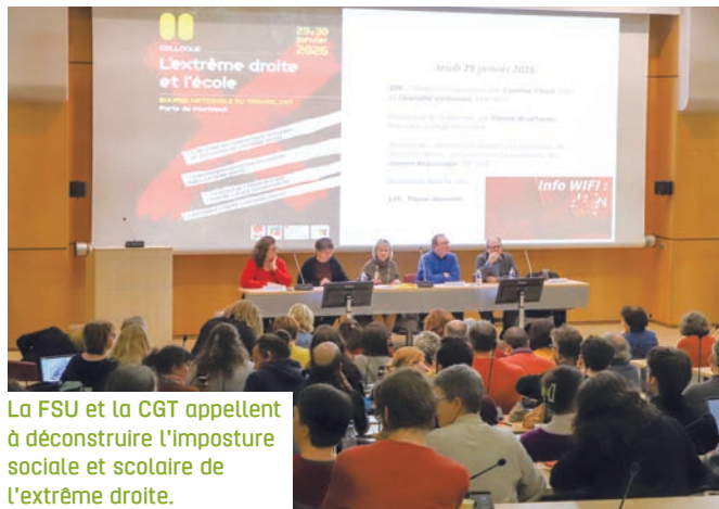
La FSU et la CGT appellent à déconstruire l'imposture sociale et scolaire de l'extrême droite.

C'était la première réalisation concrète grand format du travail engagé entre la FSU et la CGT dans la « Maison commune ». Il visait à la fois à mieux comprendre les idéologies éducatives de l'extrême droite et à construire la bataille commune pour défendre une école démocratique, égalitaire et émancipatrice. Pour les participant-es convaincu-es que « l'école est un enjeu primordial pour l'extrême droite », il s'agit d'agir vite, de faire front et de renforcer la solidarité syndicale face aux attaques menées contre l'institution qu'il s'agisse de l'EVARS, des contenus d'histoire ou de collègues directement visé-es par des courriers diffamatoires, raids nu-