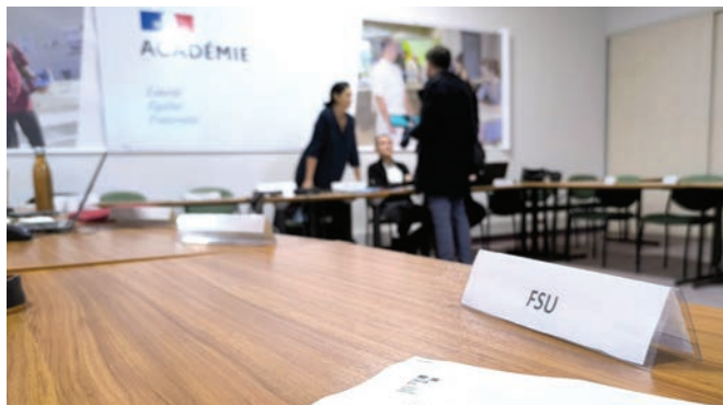
Malgré ces obstacles, la FSU reste mobilisée pour défendre les personnels.

En mettant hors-jeu les organisations syndicales des Commissions Administratives Paritaires (CAP) traitant de la mobilité et des avancements, le gouvernement a méthodiquement détruit un demi-siècle de transparence. Désormais, sur les mutations comme sur les promotions, l'administration décide seule, faisant fi du contrôle collectif qui protégeait les agent-es des erreurs. Le passage aux Lignes directrices de gestion (LDG) a instauré une forme d'arbitraire institutionnalisé. La mutation, moment charnière où se jouent l'équilibre familial et la vie professionnelle doit rester un droit fondé sur des règles claires prenant