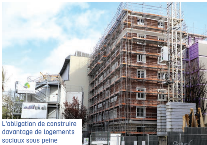
L'obligation de construire davantage de logements sociaux sous peine d'amendes.

Une crise pourtant indiscutable, le dernier rapport de la Fondation pour le logement tirant à nouveau la sonnette d'alarme en mettant particulièrement en lumière le poids croissant de l'hébergement chez un tiers comme un terrible révélateur du mal-logement. Pour autant, alors que les ménages demandant l'accès à un logement social atteignent le nombre record de 2,9 millions, les obligations légales de taux de logements sociaux viennent d'être revues à la baisse dans nombre de communes. La loi Solidarité et renouvellement urbain (SRU) fixe en effet ce taux à 25 % mais prévoit un seuil réduit à 20 % en fonction d'un ratio estimant la « tension locative ». Le ministre du logement vient de modifier unilatéralement ce ratio du nombre de