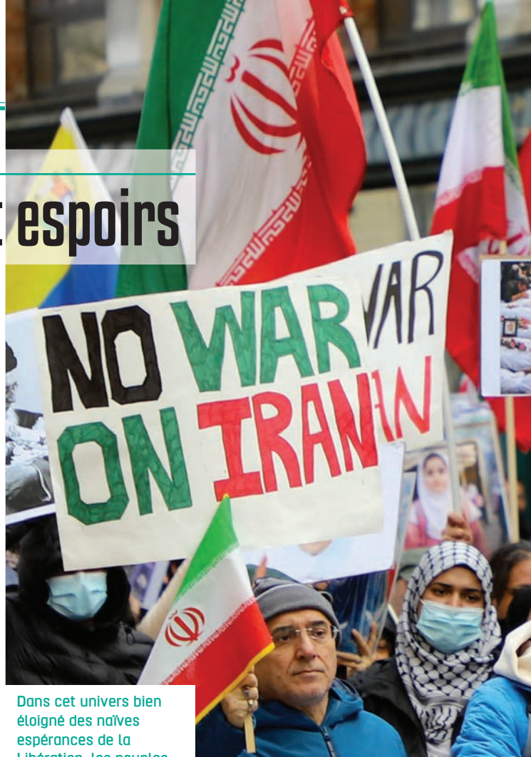
Dans cet univers bien éloigné des naïves espérances de la Libération, les peuples ne restent pas inactifs.

Quand et pourquoi ce monde a-t-il disparu ? Dès 1991 avec la chute de l'URSS qui rend dès lors, aux yeux des États-Unis, la recherche de compromis inutile dans leur course aux ressources naturelles et aux marchés de consommation ? En 2001 avec l'attaque des tours jumelles par des islamistes qui incarnent dans leur folie meurtrière la soif de revanche d'un Sud dit global face au Nord