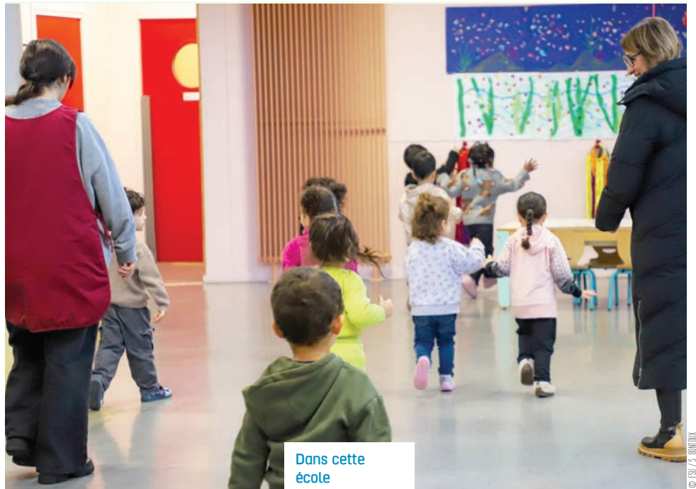
Dans cette école élémentaire du 17 e arrondissement, une continuité se construit au quotidien.

S ouvent perçu comme un simple prolongement de la journée, le périscolaire est pourtant un espace éducatif à part entière. Dans une école élémentaire du XVI e arrondissement, cette continuité se construit au quotidien, dans un dialogue étroit entre animateurs, animatrices et enseignants.