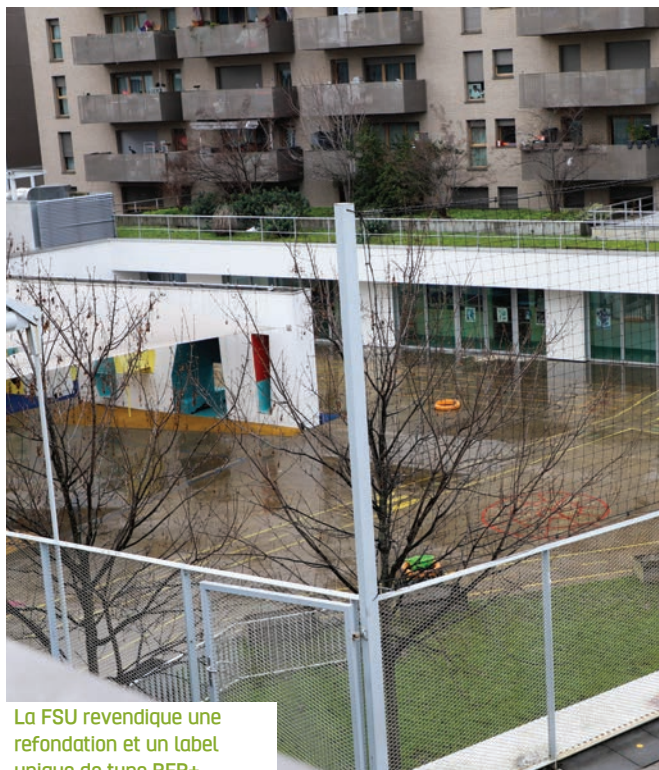
La FSU revendique une refondation et un label unique de type REP+.

À la rentrée 2026, un dispositif limité est mis en place : 21 collèges et 68 écoles « présentant d'importantes fragilités sociales » intégreront des contrats locaux d'accompagnement (CLA). Le ciblage est particulièrement restreint : les collèges retenus ont un indice de position sociale (IPS) inférieur à 80, et seules 68 écoles avec un IPS inférieur à 90 sont concernées, alors que plus de 2 100 écoles se situent sous ce seuil. Les écoles « orphelines » et des collèges aux caractéristiques sociales proches des REP ou REP+ resteront sans moyens adaptés. Il s'agit avant tout d'une « mesurette » accompagnée de peu de moyens. Les financements seront conditionnés à des projets et à des objectifs de performance mesurés par les évaluations na-