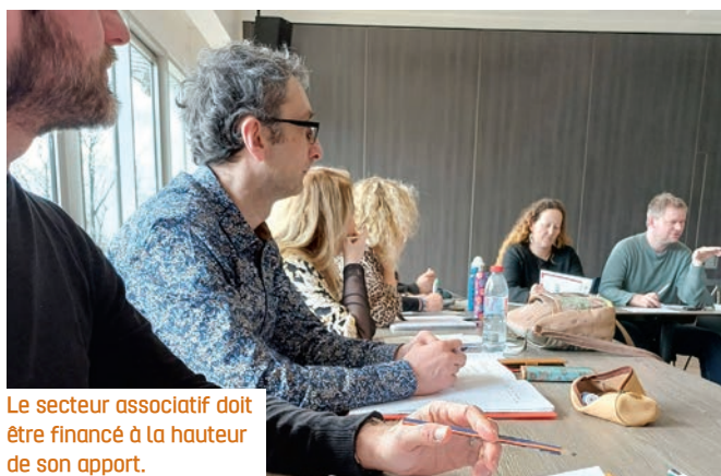
Le secteur associatif doit être financé à la hauteur de son apport.

Une structure sur quatre a dû ainsi réduire son activité en 2025, conduisant même 9 % d'entre elles à procéder à des licenciements, des plans de sauvegardes voire des liquidations, le total de ces différentes procédures ayant doublé en l'espace de trois années. Le Mouvement associatif estime être « au pied du mur » malgré la « très grande capacité de résilience face aux crises ou aux coupes budgétaires » dont ont toujours réussi à faire preuve les associations. Le budget 2026 devrait malheureusement encore amplifier cette crise avec